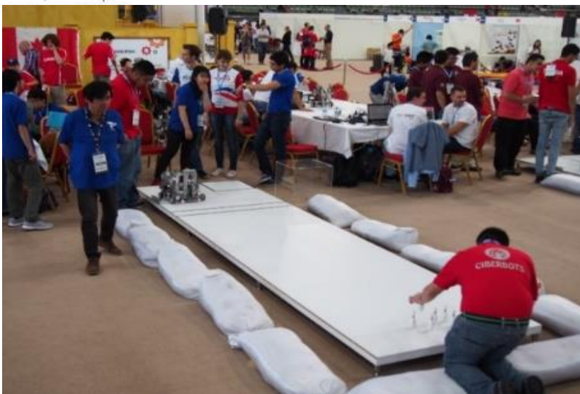
帝京大学のチームを 率います。